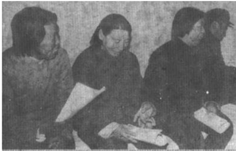
出席市二届人大三次会议的东营区部分妇女代表，结合李殿魁市长作的《政府工作报告》，畅谈了在新形势下抓好社会主义精神文明建设的重要意义。

会议指出，完成今年的各项任务还有不少困难，但这些困难都是前进中的困难，是完全能够克服的。会议号召各级政府和全市人民更加紧密地团结在以江泽民同志为核心的党中央周围，在市委领导下，坚持“一个中心、两个基本点”，贯彻治理整顿、深化改革的方针，同心同德，励精图治，不断加强社会主义物质文明、精神文明建设，为振兴东营经济、加速胜利油田和黄河三角洲的开发建设而努力奋斗。